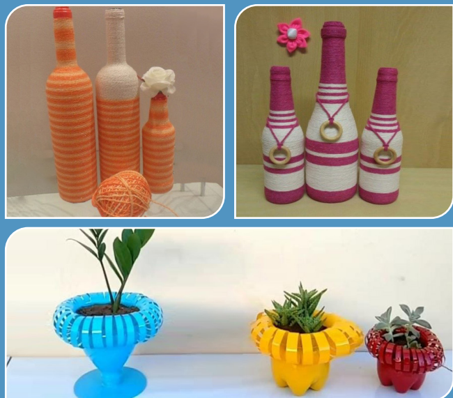
Imagens: Milton Nunes

Indígena da etnia Galibi Marworno, mora na aldeia Kumarumã. É Professor formado pela UNIFAP, em Licenciatura Indígena. Pertence ao Grupo Waçá'Uará, um coletivo de artistas indígenas de Oiapoque. Milton é um artesão que trabalha em sua aldeia com o reaproveitamento de garrafas PET e de vidro, itens encontrados com facilidade na comunidade. Assim, transformando lixo em arte, tem sido possível reduzir o volume de resíduos descartados na comunidade e, ainda, gerar renda aos artesãos que comercializam suas peças.