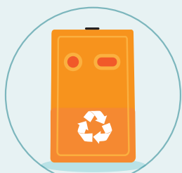
Pilhas e baterias