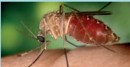
Figura 01

A febre Oropouche é uma doença viral causada por um arbovírus , a doença tem sintomas semelhantes aos da dengue, zika e chikungunya.